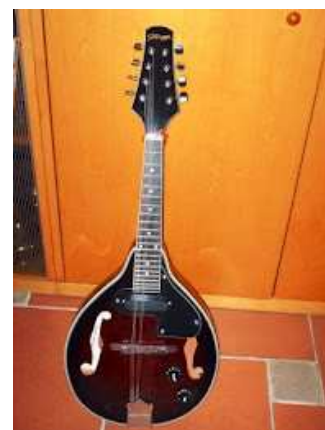
Ultimo acquisto...un mandolino