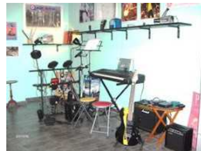
...qui posso sfogarmi...senza dare fastidio ai vicini....