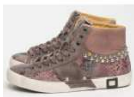
D.a.t.e. Sneakers Cooper Lux Snake Beige D.a.t.e. 37