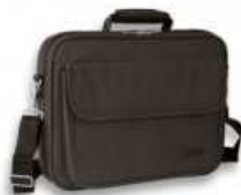
Borsa Notebook 15.6" Nera Divers