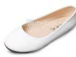
Tacco Piatto Ballerine Scarpe Da Donna (Più Colori)